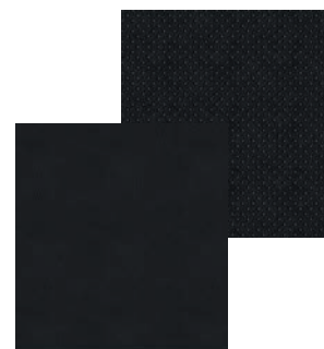
Sellerie Cuir Tissu noire G