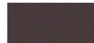
CUIR NAPPA** PRUNE SIÈGES « MONOFORM STYLE »

*Support genoux, supports latéraux, assise et dossier en cuir. Appuie-tête, partie haute du dossier, place centrale de la banquette arrière et parties extérieures des sièges en similicuir.