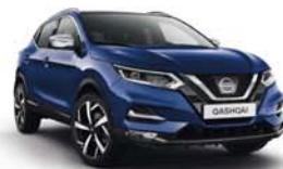
BLEU INDIGO - M - RBN