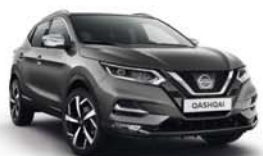
GRIS SQUALE - M - KAD