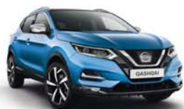
BLEU TOPAZE - M - RCA