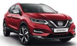
ROUGE MAGNÉTIQUE - M - NAJ