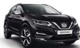
CASSIS - M - GAB