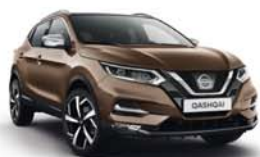
BRONZE INTENSE - M - CAN