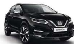
NOIR MÉTALLISÉ - M - Z11