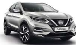
GRIS PERLE - M - KYO