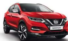
ROUGE TOSCANE - O - Z10