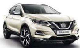
BLANC LUNAIRE - M - QAB