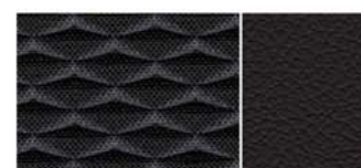
CUIR* / TISSU NOIR SIÈGES « MONOFORM STYLE »